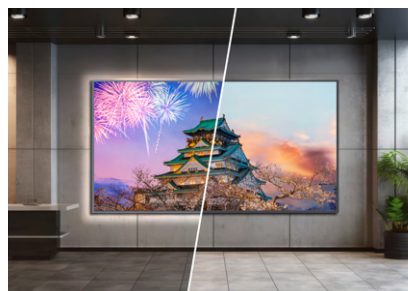
Đồ họa chiếu sáng trước/sau