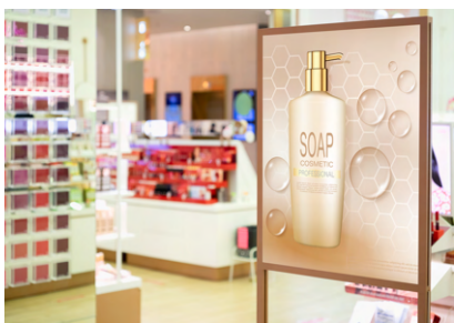
Quảng cáo trong cửa hàng

XPJ-1682UR lý tưởng để sản xuất nhiều loại đồ họa chất lượng cao: bản in quảng cáo trong cửa hàng, bản in trang trí tường tùy chỉnh, đồ họa triển lãm, đồ họa POP & bán lẻ, bản in sàn & cửa sổ, bản in mỹ thuật và hơn thế nữa.