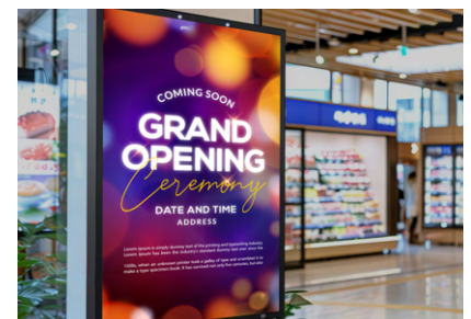
Biển hiệu backlit