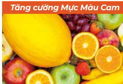
Màu sắc Nổi bật & Sống động hơn Hình ảnh chỉ nhằm mục đích minh họa, có thể khác với in thực tế.