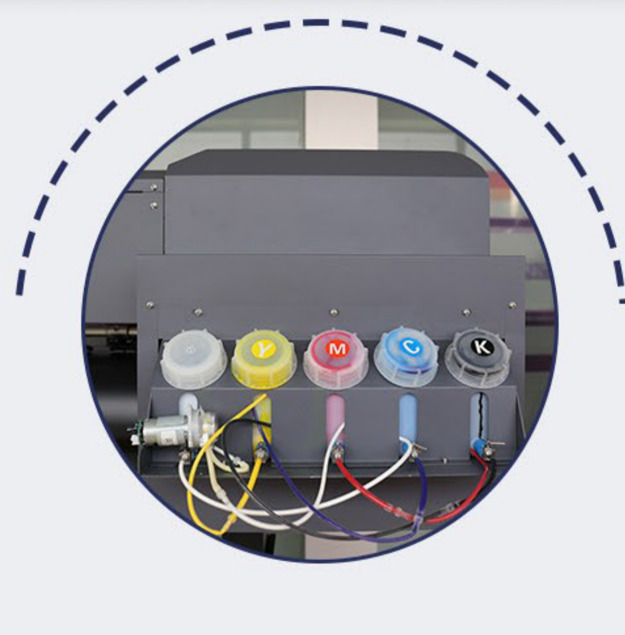
CẤP MỰC TỰ ĐỘNG