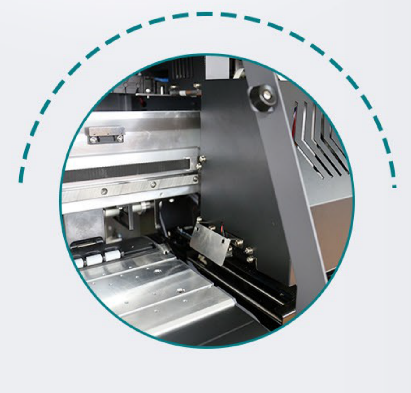
HỆ THỐNG CHỐNG VA ĐẬP